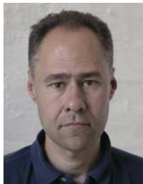
2) не правильно неоднотонный фон