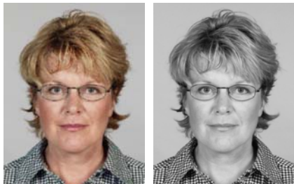
1) правильно 2) правильно

На этой странице излагаются требования к личной фотографии на паспорт, касающиеся основных параметров фотографии и других общих характеристик.