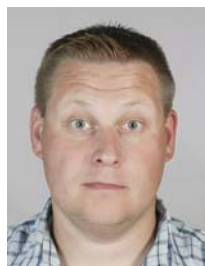
3) не правильно