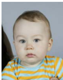
7) не правильно изображение постороннего лица