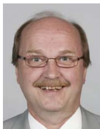
2) не правильно