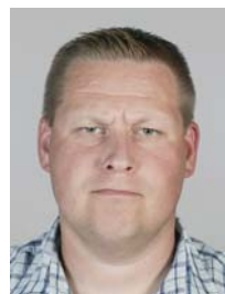
4) не правильно