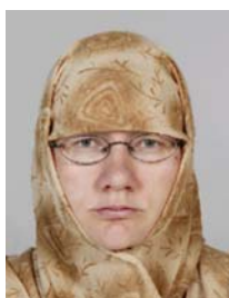
6) не правильно