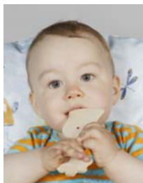
6) не правильно игрушка, на фоне -- подушка