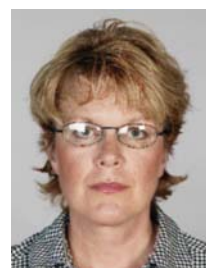
9) не правильно