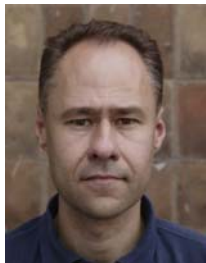
3) не правильно узорный фон