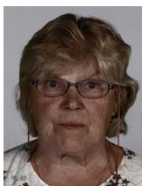
6) не правильно с недостаточной выдержкой