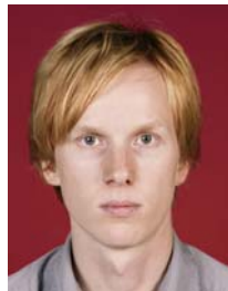
4) не правильно темный фон