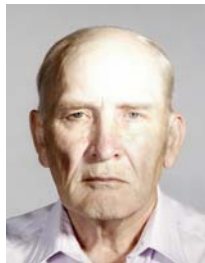
2) не правильно яркая точка на лбу