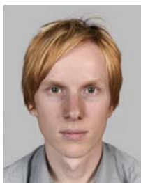
5) не правильно