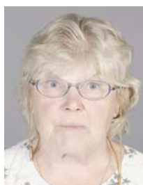
5) не правильно передержанный снимок