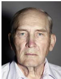
3) не правильно освещение сбоку / тень